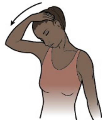
图 4. 将下巴压向胸部