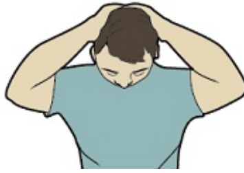
图 1. 颈部前伸