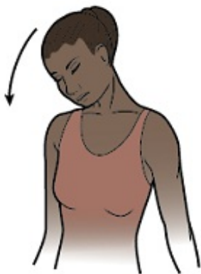
图 2. 将耳朵向下贴到肩膀