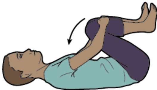
图 6. 膝盖到胸部伸展