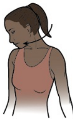
图 3. 移动头部，使鼻子指向腋窝