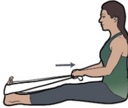
图 8. 坐姿小腿伸展