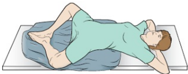
图 1. 仰卧

在您的模拟过程期间和每次治疗时，您将保持俯卧或仰卧姿势（见图 1 和图 2）。为了帮助您保持正确的体位，可能会对您身体需要保持静止的部分制作模具。您的放射治疗师会帮您制作这些模具。