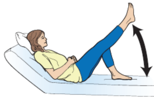
图 7. 抬升腿部。