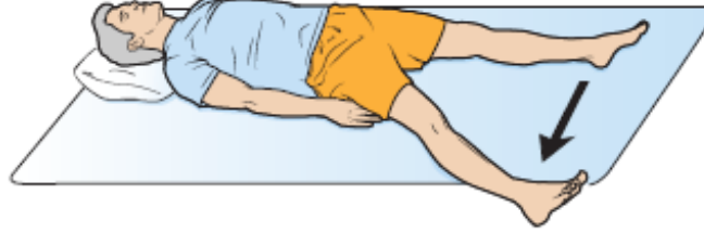
图 5. 外展肌强化练习