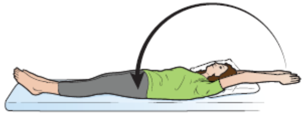
图 11. 头上方伸展