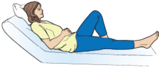
图 6. 弯曲腿部。