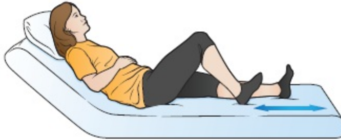
图 1. 脚后跟滑动