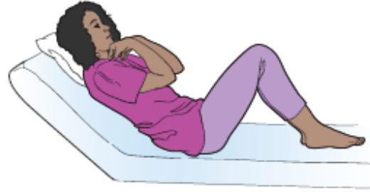
图 9. 碰触肩膀