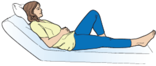
图 6. 弯曲腿部。