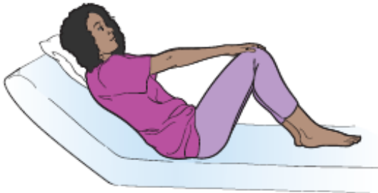
图 8. 伸出手臂