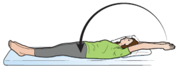
图 11. 头上方伸展