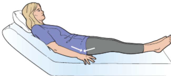
图 4. 臀肌动作组