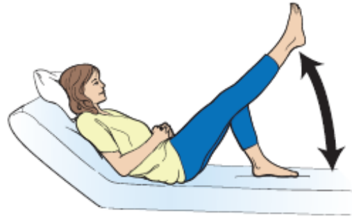
图 7. 抬升腿部。