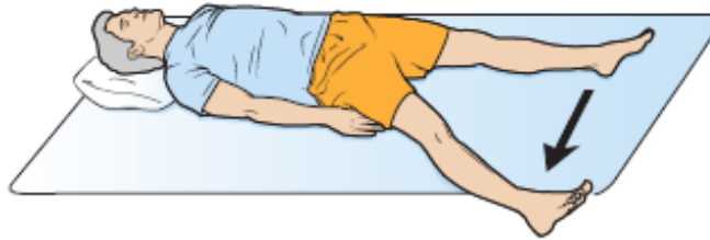
图 5. 外展肌强化练习