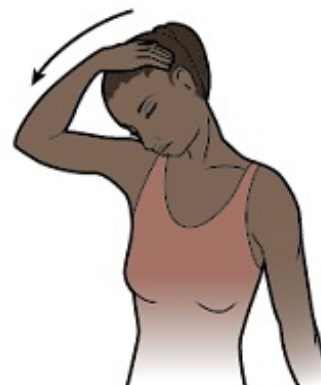
Рисунок 4. Прижмите подбородок к груди