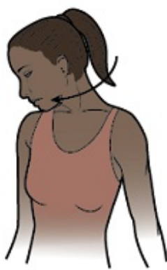
Рисунок 3. Поверните голову, чтобы нос был направлен на подмышку