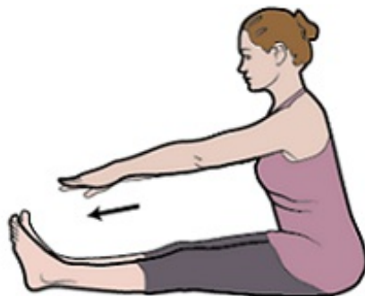
Рисунок 7. Растяжка мышц задней поверхности бедра