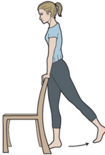
Рисунок 2. Махи ногами назад в положении стоя