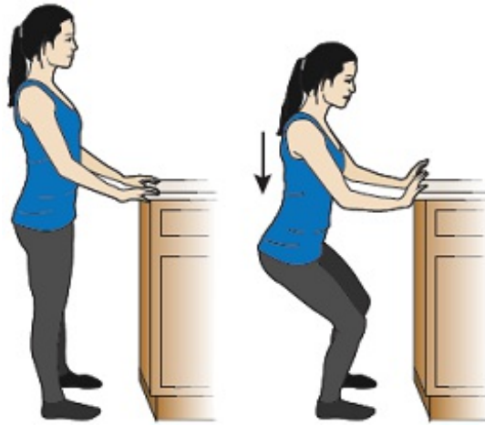
Рисунок 3. Мини-приседания