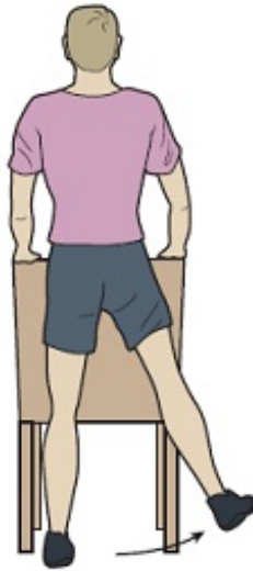
Рисунок 1. Махи ногами в сторону в положении стоя