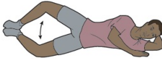
Рисунок 11. Упражнение «Раскладушка»

If you have questions or concerns, contact your healthcare provider. A member of your care team will answer Monday through Friday from 9 a.m. to 5 p.m. Outside those hours, you can leave a message or talk with another MSK provider. There is always a doctor or nurse on call. If you're not sure how to reach your healthcare provider, call 212-639-2000.