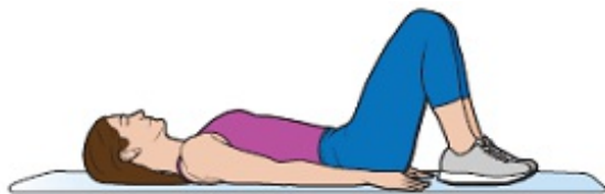
Рисунок 7. Положение лежа на спине с согнутыми в коленях ногами