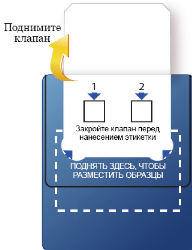
Рисунок 1. Поднимите клапан диагностической карты.