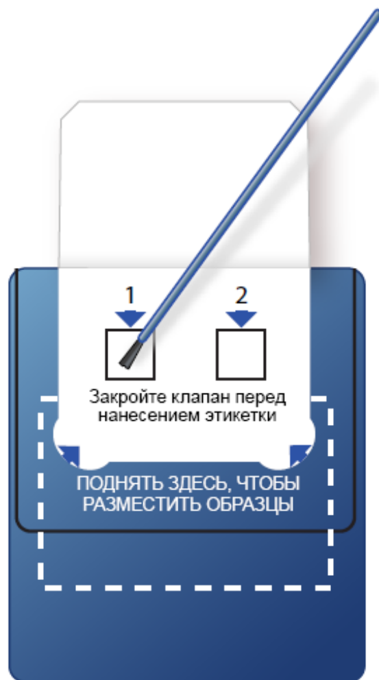
Рисунок 3. Потрите щеточкой внутри квадрата под номером «1».