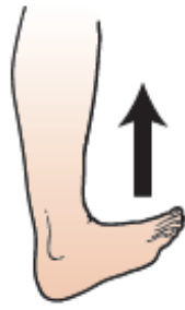
Rysunek 13. Palce stóp skierowane w górę