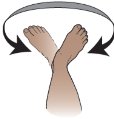
Rysunek 12. Kręcenie stopami w kostkach