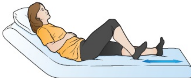
Rysunek 1. Przesuwanie pięt