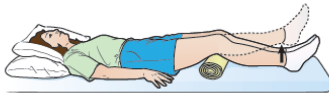
Rysunek 2. Ćwiczenia mięśnia czworogłowego z wałkiem pod kolanem