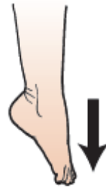
Rysunek 14. Palce stóp skierowane w dół