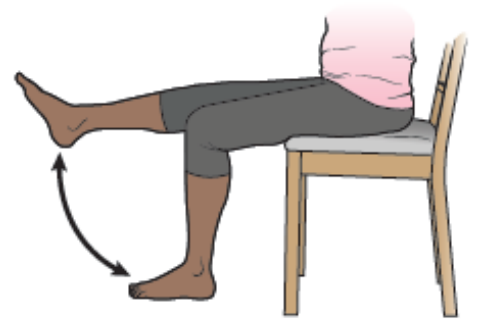
Rysunek 16. Wykop w górę