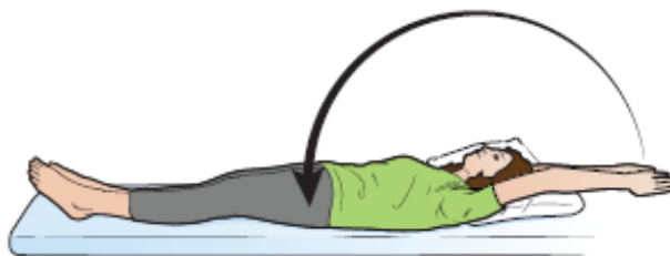
Rysunek 11. Wyciąganie rąk nad głowę