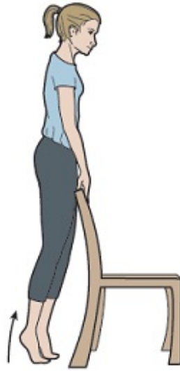
Figura 6. Levantamiento de talón