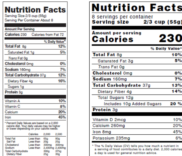
Figura 4. Etiquetas de alimentos

Los siguientes son algunos ejemplos de etiquetas de alimentos (véase la figura 4).