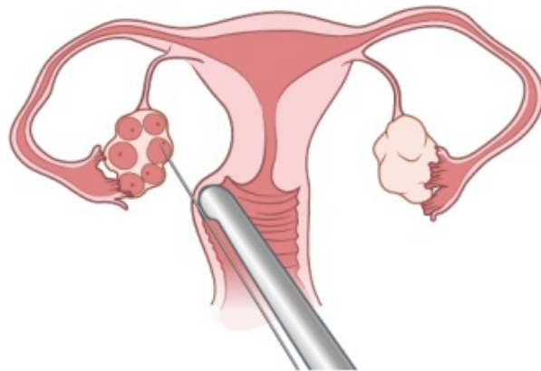
Figura 3. Obtención de óvulos