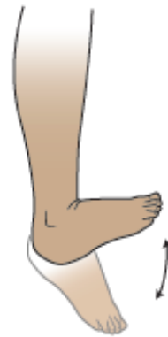
الشكل 2. تمارين الكاحل