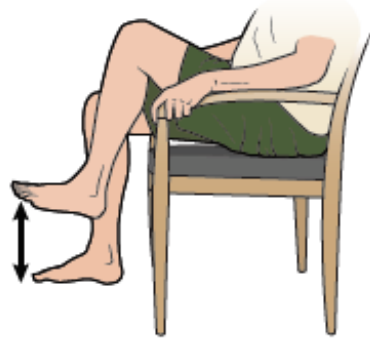
الشكل 3. المشي في المكان