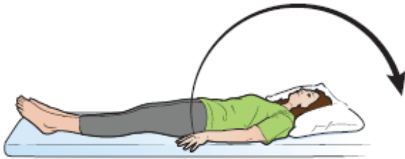
الشكل 6. الذراعان على الجانبين