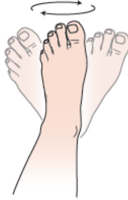
الشكل 1. تحريك الكاحل بشكل دائري