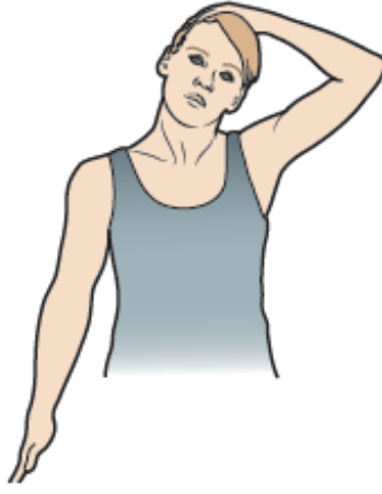
الشكل 9. مد العنق الجانبى